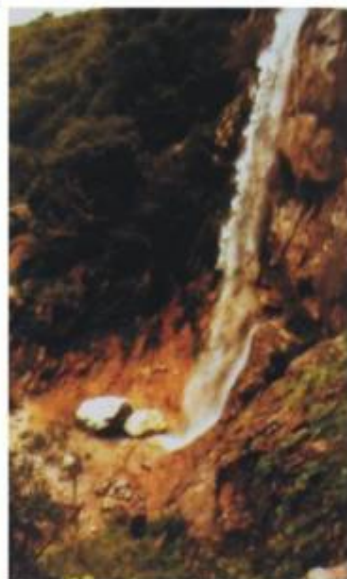
Rápel 26: Febrero 1998

TOPOGRAFIA ORIGINAL 1998: BALTASAR FELGUERA MODIFICADO 2007: CHEMA GOMEZ G.E.A CAMPILLOS